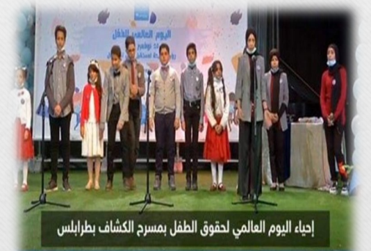
إحياء اليوم العالمي لحقوق الطفل بمسرح الكشاف بطرابلس