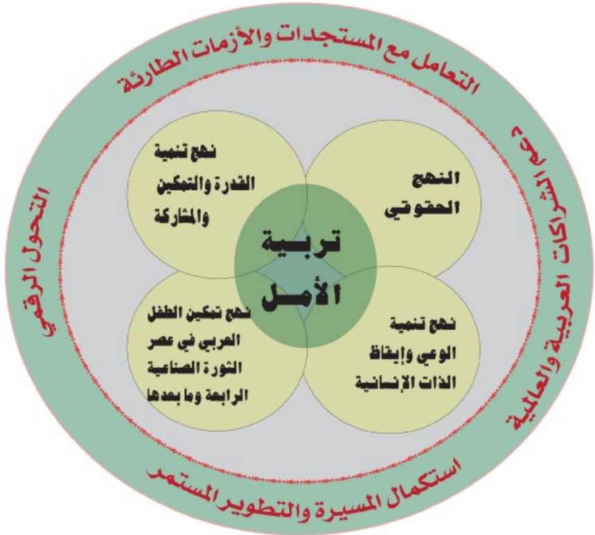
الإطار الفكري لنموذج تربية الأمل

□ تكونت هذه الدوائر عبر مسيرة المجلس العربي طوال تاريخه فكرياً وممارسة، دراسات ميدانية، تقارير، وممارسات عملية في مشاريع تنموية.